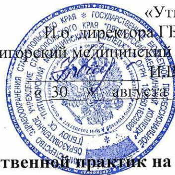
График прохождения учебной и производственной практик на I полугодие 2024-2025 учебного года по специальности 34.02.01 Сестринское дело